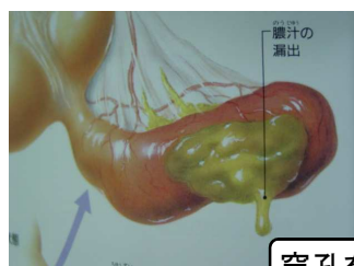
穿孔をおこした状態

虫垂組織が壊死してしまいます。すでに穿孔があり、腹膜炎、膿瘍を伴う状態です。かなり進行してしまっており緊急な手術が不可欠です。