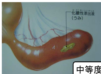
中等度に進んだ状態

膿が虫垂内部に充満しているが、穿孔はないが虫垂壁からの膿の滲出がみられる状態です。手術は不可欠となります。